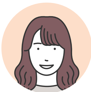
恋探し人(ニックネーム: なな)

職業: マッサージ 体型: 普通 年齢: 40代前半 たばこ: 吸う(電子タバコ) 地域: 大阪 年収: 300万~500万未満 身長: 165cm位 学歴: 大学卒