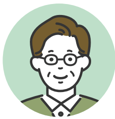
マッチメイト(紹介者) (ニックネーム：タカ)