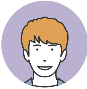
恋探し人(ニックネーム: まさ)

職業: 美容関係 体型: 普通 年齢: 20代後半 たばこ: 吸う 地域: 大阪 年収: 300万未満 身長: 180cm位 学歴: 高校卒