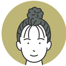
マッチメイト(紹介者) (ニックネーム: さち)