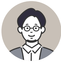
マッチメイト(紹介者) (ニックネーム: サトシ)