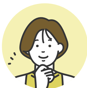
恋探し人(ニックネーム：悠)

職業：医療関係 体型：やや太め 年齢：30代後半 たばこ：吸わない 地域：大阪 年収：300万～500万未満 身長：155cm位 学歴：高校卒