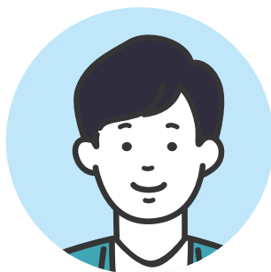
恋探し人(ニックネーム：シン)

職業：建築関係 体型：普通 年齢：30代後半 たばこ：吸わない 地域：大阪 年収：わからない 身長：165cm位 学歴：高校卒